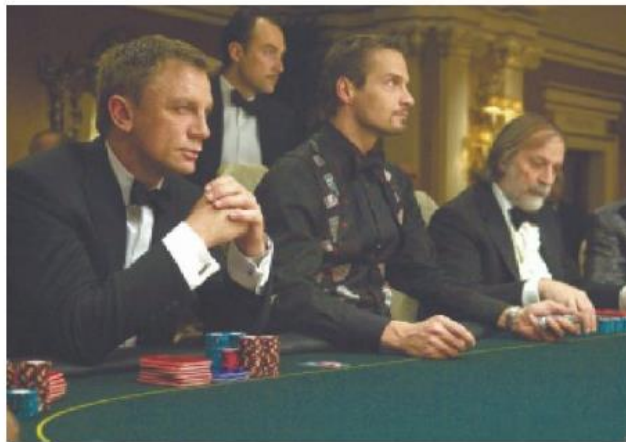
דניאל קרייג (משמאל) בתפקיד ניימס בונד ב"קזינו רויאל". קיבל טיפול מרחוק

רית היא הודקנות האוכלוסייה, שאין לה פתרון כולל במערכת הרפואית. סיבה נוספת היא המחיר סור ביורפאים ומיטות אשפוז. הנתונים האלה לא מתבטאים בשח"ל העולמית, שהמניה שלה שומרת על יציבות. אני רק מנהל את שח"ל ישראל, עונה קריסטל. "קשה לנתח את השוק כי יש בישראל עוד 300-400 אלף חולים שהשירות הזה רלי ורטי להם". איך עובר תהליך קבלת החליטה? קריסטל: "רופא מגיע לבית הלקוח, מבצע את כל הבדיקות ובונה לחילה את כל התיק הרפואי, עם כל רשומות העבר. זה עוזר לנו בקבלת ההחלטות. כשהמטופל מתקשר אלינו אני חנו רואים אונליין את כל התיק שלה. לפעמים צריך רק לאון אותו תרופות ולפעמים צריך לקחת אותו לבית החולים. כנלל הטיפול מרוחק 5% מהמטופלים מגיעים לבית החולים". אירועי התמונה מספר שתיים בישראל הוא אירועי לב, כמה אירועים יש בשנה? קריסטל: "כ-20 אלף, אבל המספר כל הזמן גדל". למה? גל: "אורח החיים המודרני יותר הוצף והאוכלוסייה מורקנת". קריסטל: "המהלך הגדול ביותר בישראל הן סכרת והשמנה. אירועי לב מתרחשים גם מנחלות וגם ממתחים. כל מי שעובר אירוע לבבי הופך להיות חולה כרוני. כל מי מר מחייב מעקב. בנוסף יש גידול